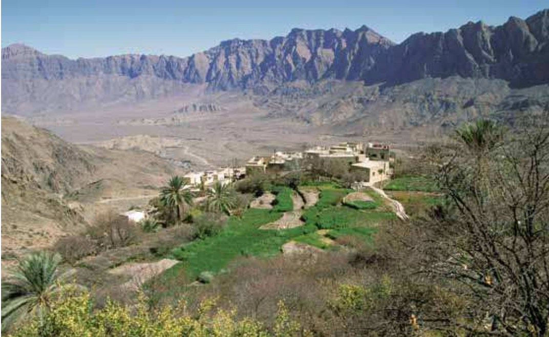
Jebel Al Akhdar-Gebirge

Im klimatisierten 4x4-Geländefahrzeug und mit dem versierten Fahrer auf Hauptstrassen und Sandpisten unterwegs zu atemberaubenden landschaftlichen Erlebnissen im Oman. Spektakuläre Höhepunkte – von 2000 m im majestätischen Jebel Al Akhdar Gebirge bis zu den 200 m hohen Dünen in der gewaltigen Wahiba Sands Wüste und mit viel Sehenswertem dazwischen. Eine abwechslungsreiche Kurzreise um grosse Kontraste und feine Facetten zu entdecken.