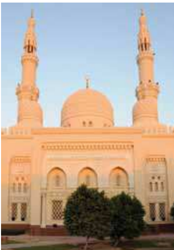
Jumeirah Moschee, Dubai