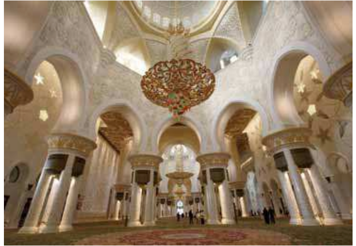
Sheikh Zayed Moschee