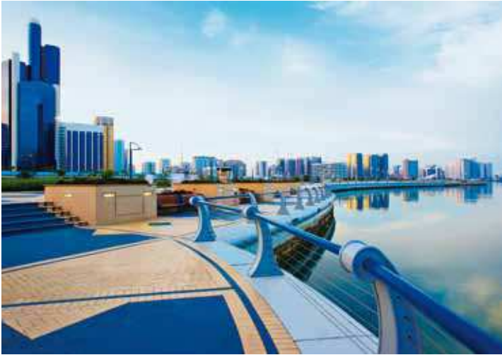
Abu Dhabi Corniche