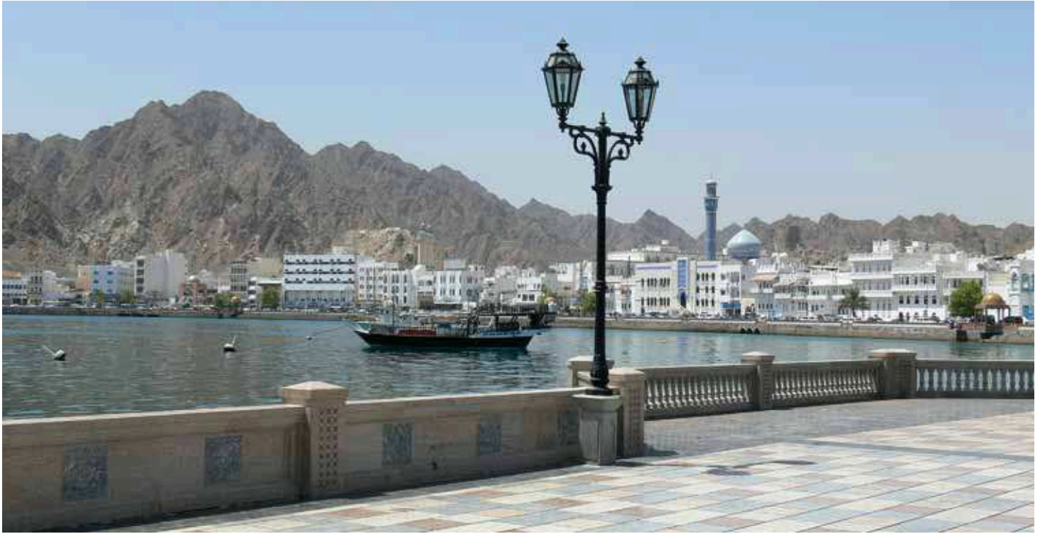
Muscat, Stadtteil Muttrah (Oman)

In einer Woche erleben Sie auf dieser geführten Busrundreise den märchenhaften Zauber der Vereinigten Arabischen Emirate und des Omans. Eine wahrlich reizvolle Mischung für 1001 unvergessliche Eindrücke. Dubai, Muscat, Abu Dhabi – der landeskundige Reiseleiter entführt Sie täglich in die vielschichtige Wunderwelt des Orients – farben- und formenreich wie ein glänzendes Kaleidoskop. Ein attraktives Programm.